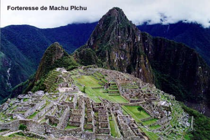
Forteresse de Machu Picchu

L'origine des Incas reste mystérieuse en raison de l'absence d'écriture dans les civilisations précolombiennes. Leur essor et leur degré de civilisation avancée reste une énigme pour beaucoup. Le déclin des grandes cités perdues, en partie explicable par la conquête espagnole, reste un mystère. Qui sont les Incas ? Quelle est leur légende ? C'est au début du XIIème siècle que la civilisation Inca serait née. Selon la légende, un groupe de nomades était à la recherche de l'endroit idéal pour s'établir. Après avoir appris l'art de la civilisation, ces nomades avaient été envoyés sur Terre par le Dieu Soleil : Inti. Ils avaient pour mission de diffuser son nom et de civiliser les Hommes.